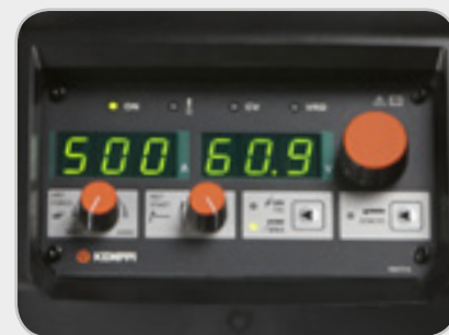
Jednoduchý ovládací panel