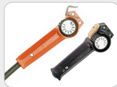
R10 a R11-T

K dispozícii sú dva diaľkové ovládania, ktoré prispievajú k zvýšeniu efektivity a komfortu pri práci. S diaľkovým ovládačom R10 upravíte zvaracie parametre pohodlne priamo z miesta zvarania. Bezdrôtové diaľkové ovládanie R11-T vám ponúkne ešte viac voľnosti pri práci a presúvaní.